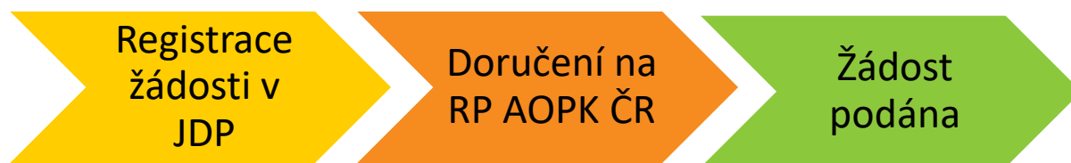
Obrázek č. 1: Kroky vedoucí k podání žádosti

Ekonomické přílohy ve formátu ZIP a rozpočet je nutné do JDP nahrát vždy. Ostatní přílohy, které není možné z kapacitních důvodů nahrát přímo do JDP, doručte na AOPK ČR stanoveným způsobem.