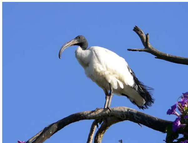
Obr. 4 Ibis posvátný .

Riziko: v místech hnízdění destrukce vegetace. Je podezřelý z přenosu chorob – často navštěvuje skládky a smetiště, odkud může přenášet např. různé patogeny na pastviny. V západní Francii prokázána likvidace vajec a mladých jedinců hnízdících rybáků (např. r. severní, r. černý), což vedlo k destrukci jejich hnízdních kolonií.