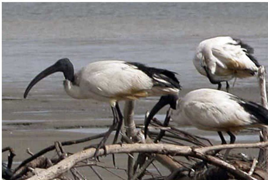
Obr. 1 Ibis posvátný.

Původ: žije především v Africe jižně od Sahary, místně též na Středním východě, Iráku a Íránu.