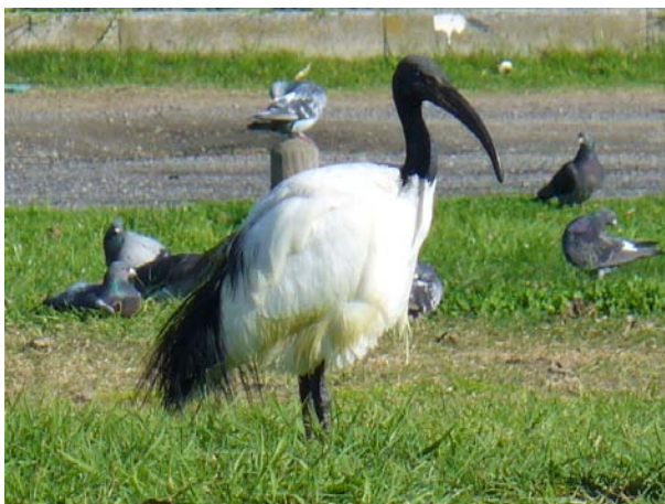
Obr. 3 Ibis posvátný .

Popis: Vysoký 60 – 85 cm, rozpětí křídel 110 – 125 cm, váží zhruba 1,5 kg. Je převážně bílý, s černými prodlouženými pery, visícími přes ocas, černé jsou i konce letek (nejlépe viditelné za letu). Má lysou černou hlavu a krk a též černý, dolů zahnutý silný zobák. Nohy jsou též černé. Obě pohlaví jsou zbarvena stejně. Mladí jedinci postrádají černá prodloužená pera a hlavu a krk mají opeřené. Ibis se většinou neozývá, na hnízdě kvičí a skřehotá. Při letu má natažený krk. Vyskytuje se jednotlivě, ale zejména v hejnech, až o několika stovkách jedinců. Osidluje mokřiny, včetně mořského prostředí. Hnízdí na stromech, keřích či skalách, často i s jinými druhy ptáků (kormoráni, volavky). Etabloval se i do obdělávané krajiny, je schopen se živit i odpadky z obydlí. Za dne se brodí mělkou vodou a loví vodní bezobratlé, drobné obojživelníky a plazy a dokonce malé ptáky. Někteří jedinci jsou stálí, jiní se pravidelně přesunují za potravou či z důvodu nepřízně počasí.